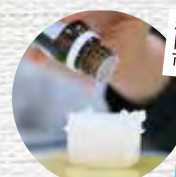
秋田市 ルベール アロマ作り・販売