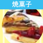
カトルセゾン キッシュ、タルト 焼菓子