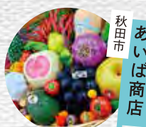
秋田市 あいば商店 野菜