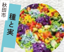
秋田市 種と実 惣菜