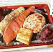
由利本荘市 ココフタツメ のり弁