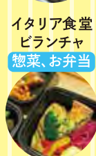
イタリア食堂 ピランチャ 惣菜、お弁当