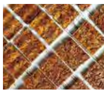
つつつやで美しい「フロランタン」