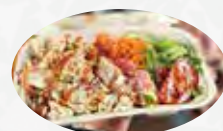
▲ローストチキン屋のオーバーライス

看板メニューの「ローストチキン」は迫力満点で肉汁溢れるジューシーな味わい。普段のお食事やお祝いのテーブルを華やかにしてくれます。食材にこだわった料理と朝市やマルシェの開催で、オープン2年目にして地域の人気店になりました。ランチはカレーやガバオライス、ルーロー飯など週ごとに変わるのでSNSをチェック！キッチンカーでは沖縄そばやチキンのオーバーライスを提供。県内各地で出店しているのでぜひお立ち寄りください。