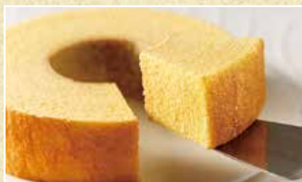
ストレートバーム

まるでバームクーヘンのカステラ。たまごたっぷり、 ふっくらジューシーな美味しさです。