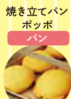
焼き立てパン ポッポ パン