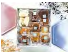
父とのコラボ商品。七夕をイメージして作られた漆器プレートと焼菓子のセット