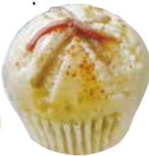
▲人気のきんぴら マヨネーズ194円