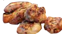
▲ナッツやチーズなど種類が豊富