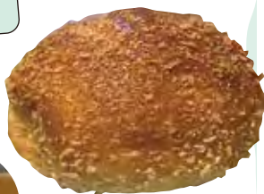
▲甘辛焼きカレーパン180円