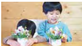
先生 花工房Field Canvasさん