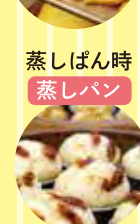
蒸しぱん時 蒸しぱん