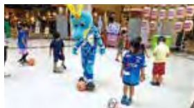
先生 ブラウブリッツ秋田さん