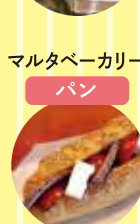
マルタペーカリー パン