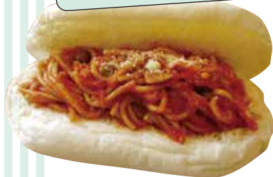
▲昔懐かしいナポリタン レギュラーサイズ330円

白くてふわふわのパンにたっぷりのフィリングを挟んだコッペパンはいかが? 店頭にはさまざまな種類の「おやつこっぺ」と「お惣菜こっぺ」が並びます。あんや自家製ホイップクリームなどのトッピング(有料)を追加して、お好みに合ったオリジナルのパンをつくってもらうこともできます!