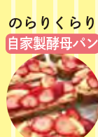
のりくらり 自家製酵母パン