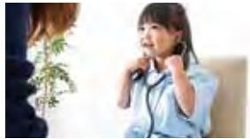
先生 やすおか小児科医院さん