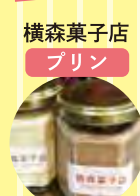
横森菓子店 プリン