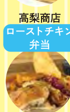
高梨商店 ローストチキン 弁当