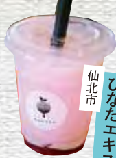
仙北市 ひなたエキス スムージー・ポタージュ