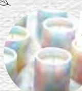
秋田市 ノアキャンドル キャンドル