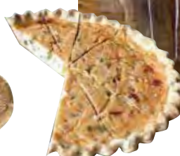
◀夏野菜のキッシュ。 卵でなく豆腐を使用