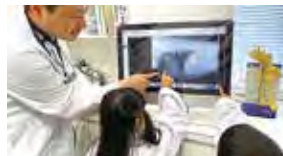
先生 あきたこまつ動物病院さん