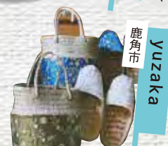
秋田市 Yuzaka 雑貨・ドリンク