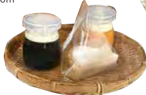
▲夏にはゼリーなどの水菓子も。 ゼラチンではなく植物性の寒天を使