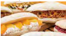
先生 ハチト製パンさん