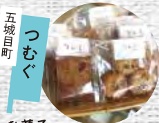
五城目町 つむぎ お菓子