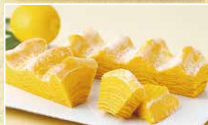
レモン香るマウントバーム

まるでバームクーヘンのカステラ。たまごたっぷり、 ふっくらジューシーな美味しさです。