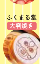
ふくまる堂 大判焼き