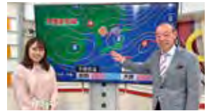
先生 秋田朝日放送さん