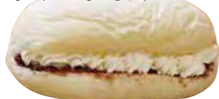
▲ハチトニあんホイップ レギュラーサイズ230円

白くてふわふわのパンにたっぷりのフィリングを挟んだコッペパンはいかが? 店頭にはさまざまな種類の「おやつこっぺ」と「お惣菜こっぺ」が並びます。あんや自家製ホイップクリームなどのトッピング(有料)を追加して、お好みに合ったオリジナルのパンをつくってもらうこともできます!