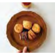
「大人が明日も頑張るためのおやつ」がキャッチコピー