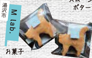
湯沢市 M Lab. お菓子