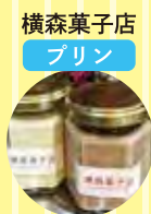
横森菓子店 プリン