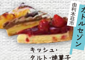
秋田市 キッシュ・タルト・焼菓子