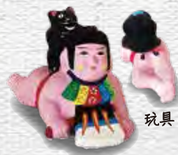
大館市 東北の酒と玩具 MUTO 玩具