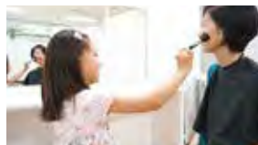
先生 VIVANT MAKEUP WOSKSさん