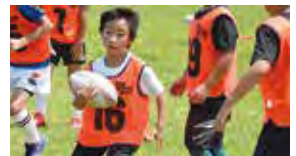
先生 秋田ノーザンブレッツさん