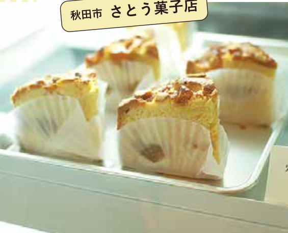
▲秋田県産りんごを使ったケーキ