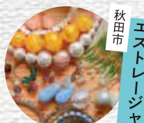
秋田市 エストレージャ ビーズアクセサリー