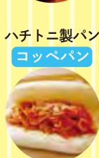
ハチトニ製パン コッペパン