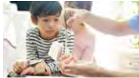
先生 クローバー デンタルさん